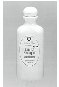
ルミーズシャンプー 300ml

また、髪が理想的な水分量を保つよう、いろいろな保湿成分が配合され、さらに、常に外気にさらされている髪を保護するカワラヨモギが含まれています。