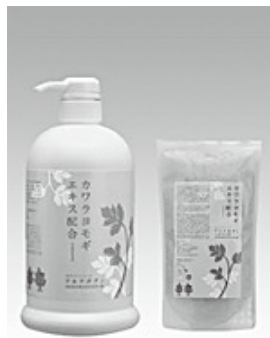
アルテボディ 800ml アルテボディ 詰替用 700ml

4000年前から生薬として使用されており、この甘草の根から抽出されるグリチルリチン酸ジカリウムには、優れた抗炎症効果があり、臨床実験でもその効果が認められています。抗炎症作用、抗ヒスタミン、抗アレルギー、解毒作用があり皮膚炎に対して有効です。