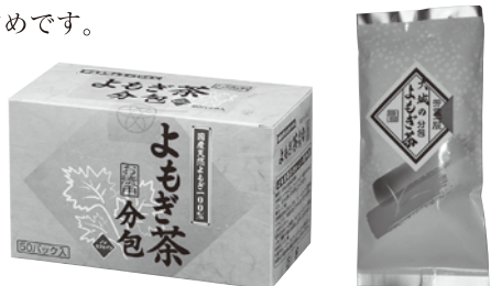
よもぎ茶分包 30パック入 (右) よもぎ茶お徳用 50パック入 (左)

☆☆☆☆☆☆☆☆☆☆☆☆☆☆☆☆☆☆☆☆☆☆☆☆☆☆☆☆☆☆☆☆☆☆☆☆☆☆☆☆☆☆☆☆