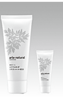
アルテナチュラル